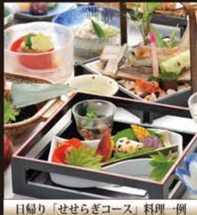
日帰り「せせらぎコース」料理一例